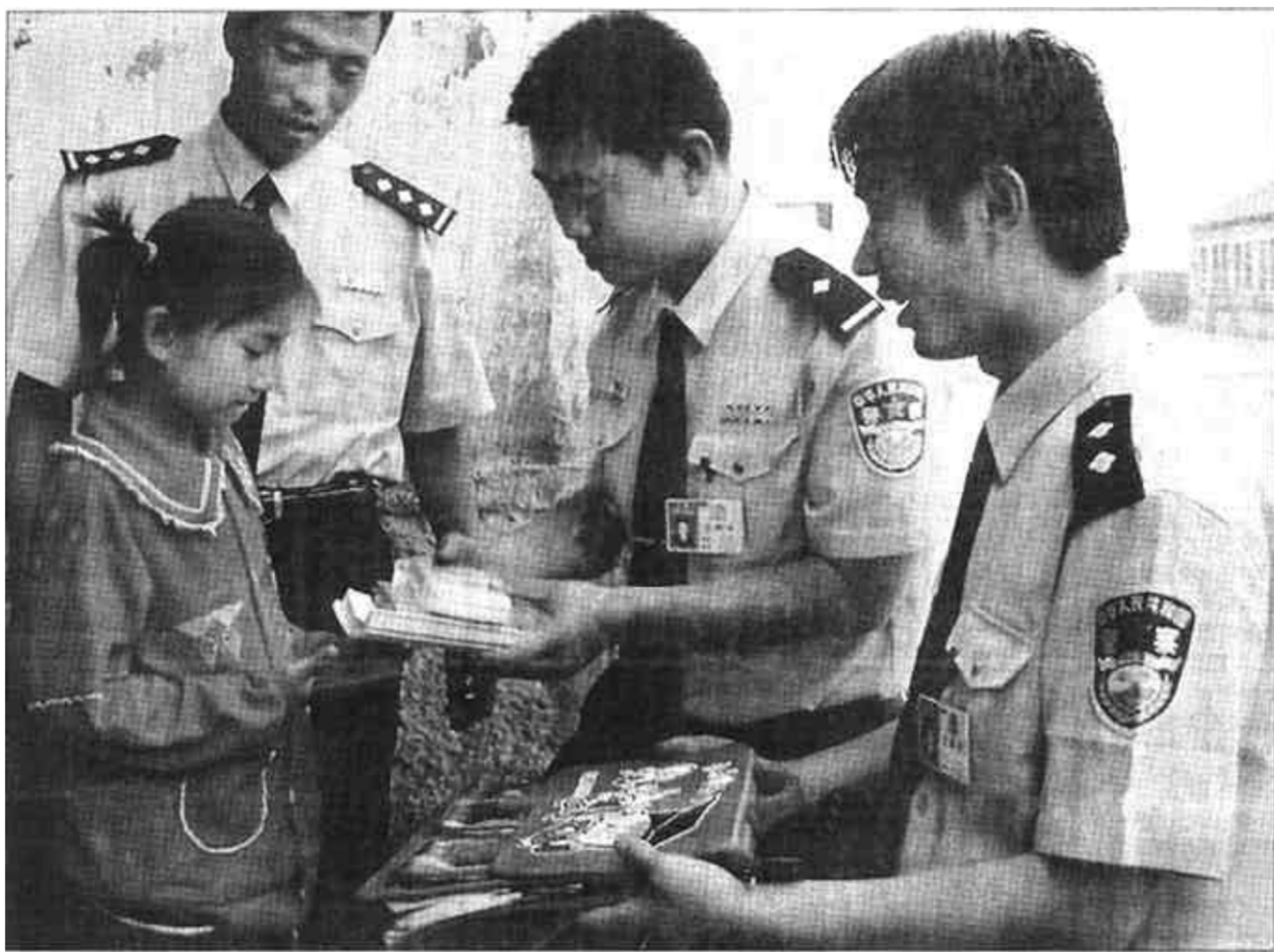
中国银行垦利支行党支部按照“围绕发展抓党建，抓好党建促发展”的工作方针，结合实际先后开展“加强党员教育、提高党员素质、树立党员形象、发挥党员作用”为主题内容的树党员形象系列教育，有力地促进了行内各项业务的发展。