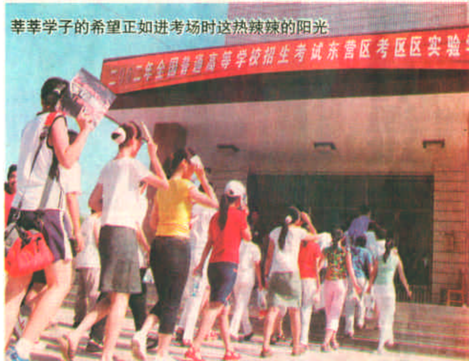
莘莘学子的希望正如进考场时这热辣辣的阳光

这些确实确实让这位外来投资者感动不已。他也表示将一心一意地搞好项目建设，为东营市的建设和发展尽自己的最大努力。（本报记者 田召斌 通讯员 耿润璞）