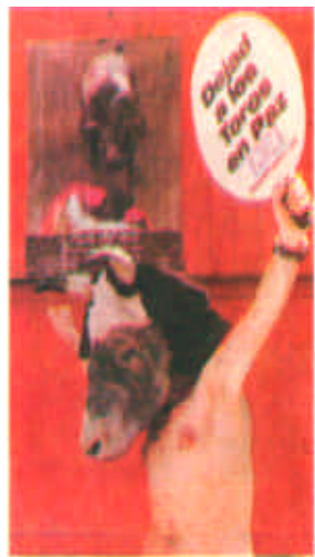
七月五日，一名动物保护组织的成员头戴牛头物，在西班牙潘普洛纳的街头抗议当地举办奔牛节。他手持标语写着“放牛一条生路”。世界著名的西班牙潘普洛纳奔牛节于本周末举行，几十头公牛将被杀死。（新华社·路透）