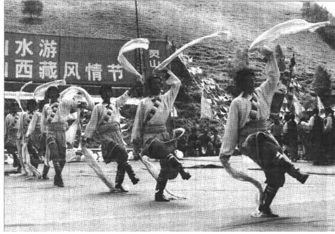
7月6日,“2002年北京门头沟区京西山水游暨第四届灵山西藏风情节”在灵山拉开帷幕。

新华社济南7月6日电(记者吕福明)山东省招生办今天宣布,今年这个省参加高考总人数突破45万人。